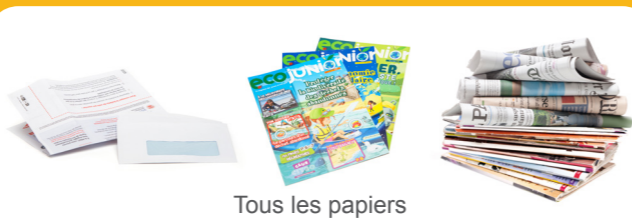
Tous les papiers