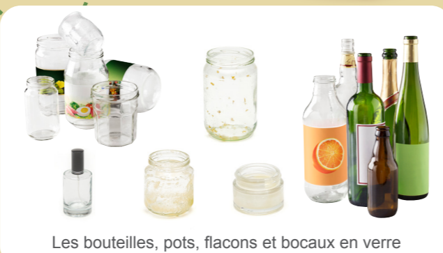
Les bouteilles, pots, flacons et bocaux en verre