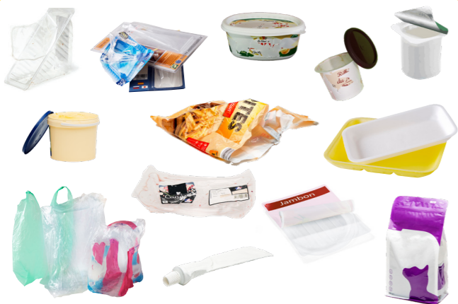
Tous les autres emballages en plastique