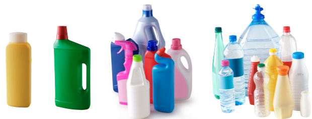
Les bouteilles et flacons en plastique

Certains secteurs du Pays fléchois ont un système de collecte différent. Renseignements sur www.paysflechois.fr