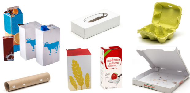
Les emballages en carton et briques alimentaires