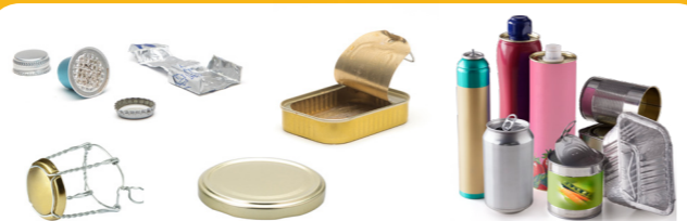
Les emballages en métal, même les petits